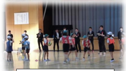
朝霞地区体育科研究授業