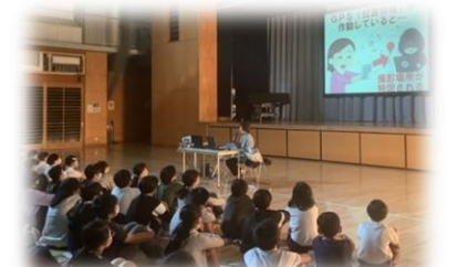
5. 6年生・非行防止教室