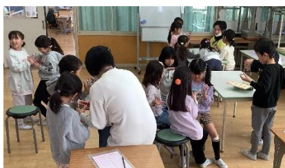
学校応援団による昼休みのあやとり教室

3人とも、高い志をもち、その実現に全力で挑んだことが伝わってきます。3月は進級・卒業の季節です。全ての児童が、この1年間の成長を糧に、次のステージに向かって目標を立て、全力で挑んでくれることを期待しています。そして、卒業を迎える6年生には、