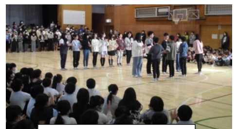
6年生から5年生への引継ぎ式

3人とも、高い志をもち、その実現に全力で挑んだことが伝わってきます。3月は進級・卒業の季節です。全ての児童が、この1年間の成長を糧に、次のステージに向かって目標を立て、全力で挑んでくれることを期待しています。そして、卒業を迎える6年生には、